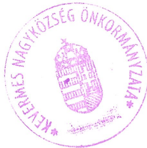
Bozó László Pénzügyi Bizottság elnöke