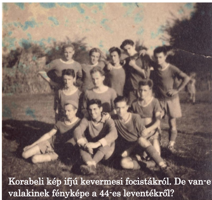
Korabeli kép ifjú kevermesi focistákról. De vannak valakinek fényképe a 44-es leventékről?